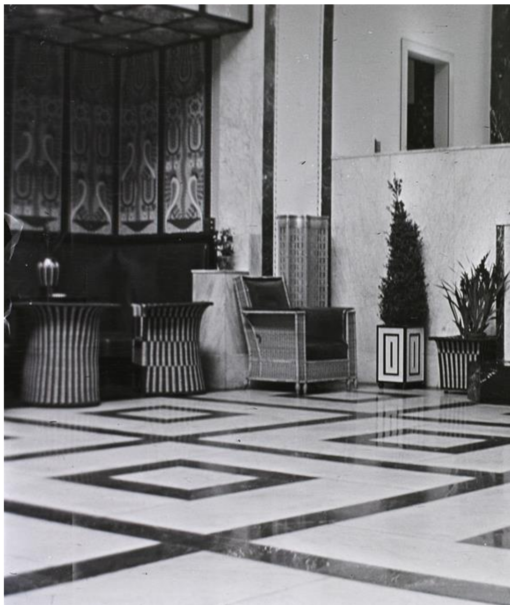
A Lipótvárosi Casino nyári helyiség