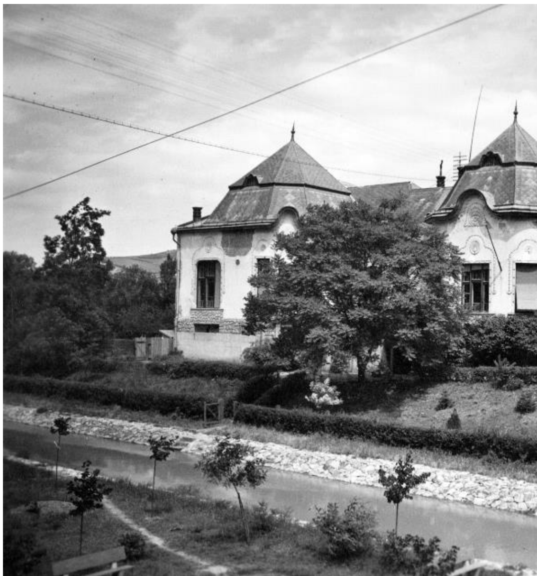
Úri kaszinó, Beregszász