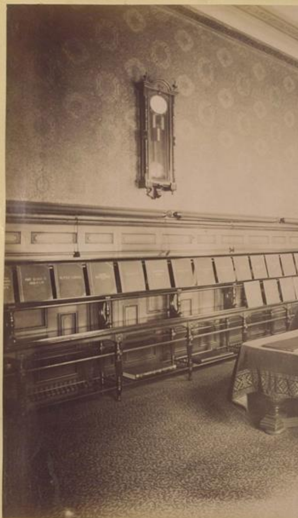
A Nemzeti Casinó ("mágnáskaszinó") helyiségei az 1890-es években Klősz György felvételein (Fortepan – Budapest Főváros Levéltára)