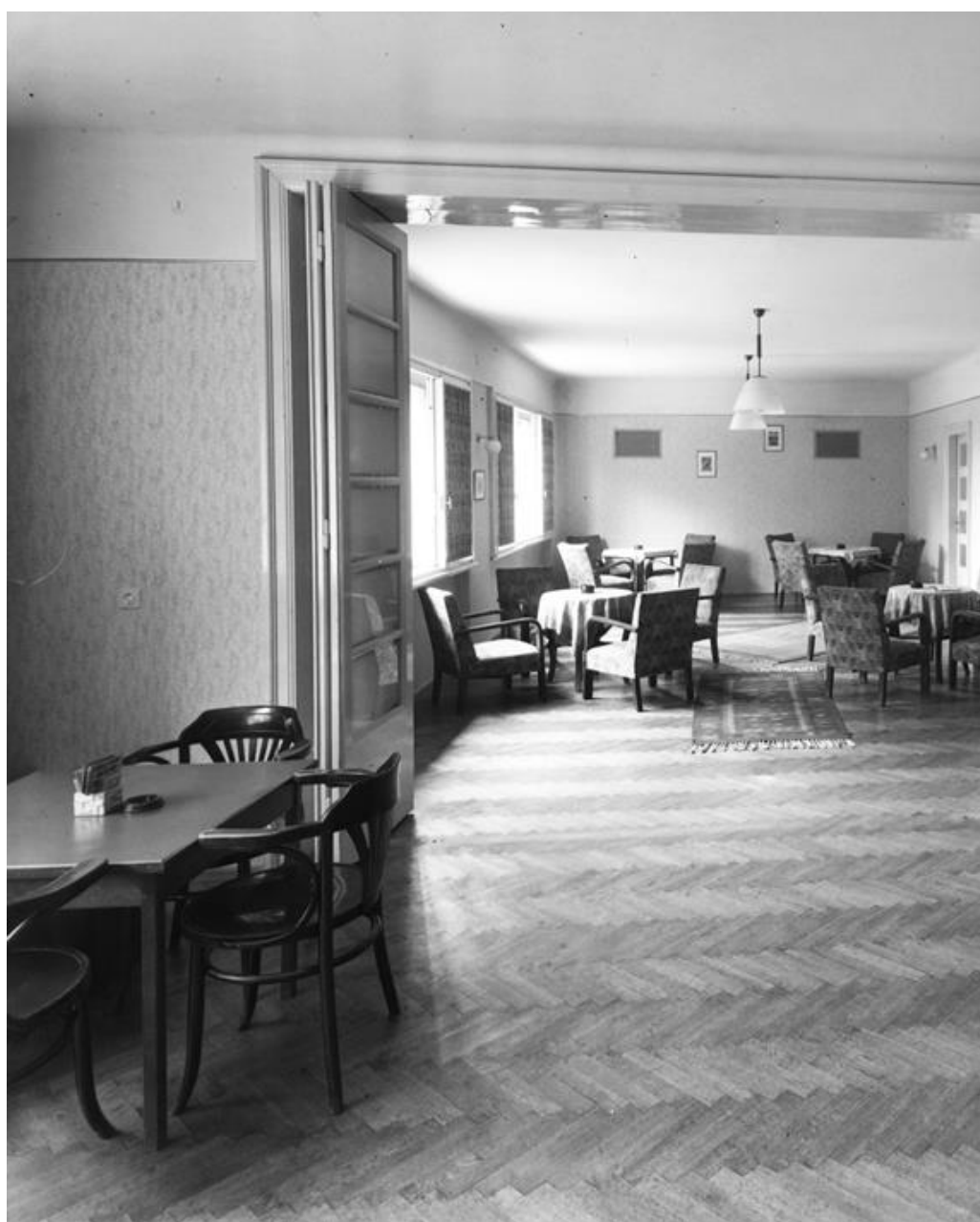
Pétfürdő, tisztí kaszinó h