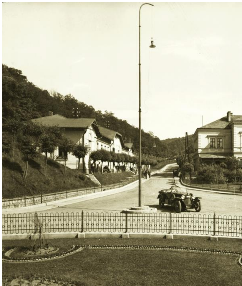
Borsodnádasi tisztikaszinó, balra az o