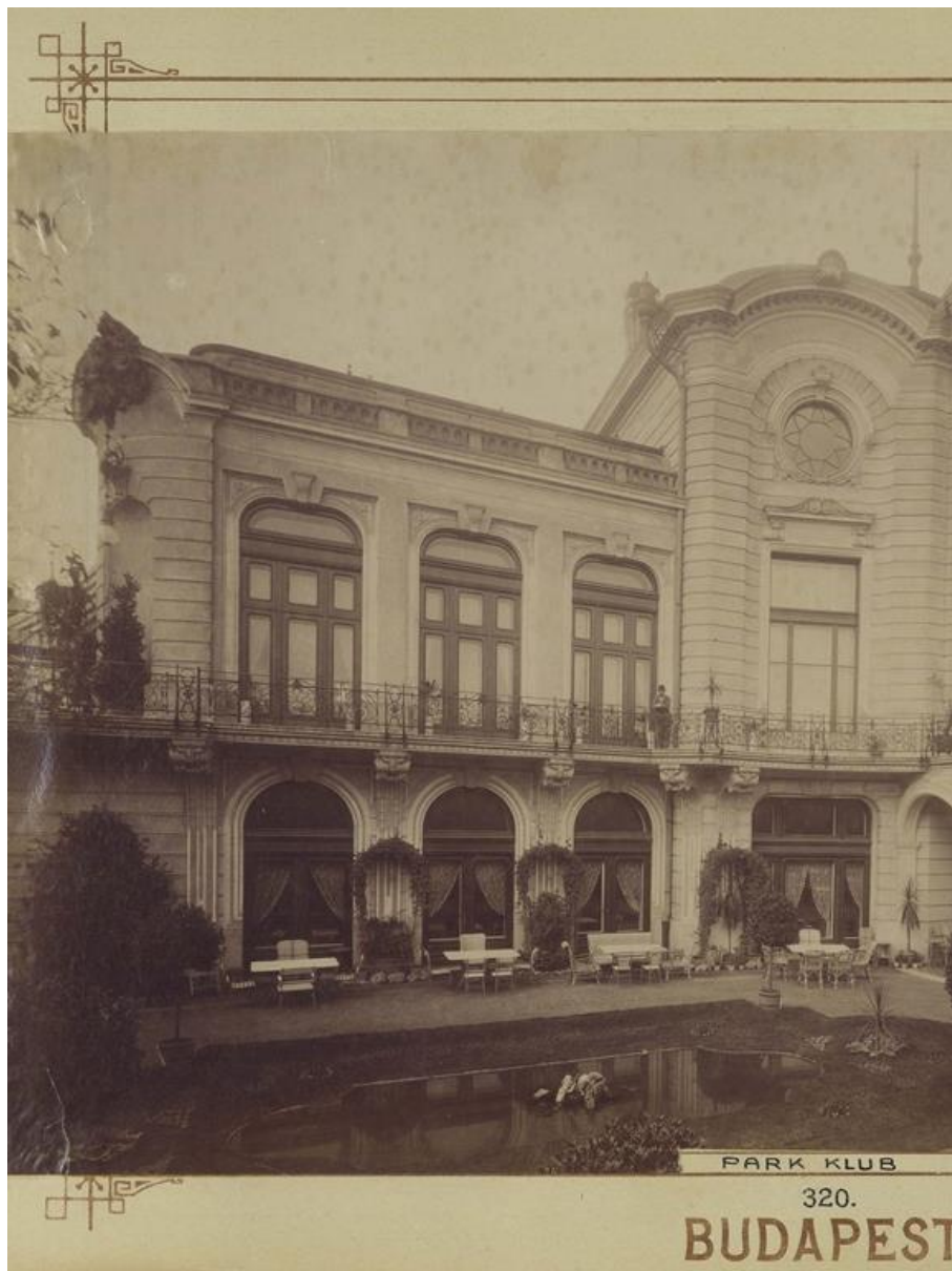
A Nemzeti Casino nyári otthona, a Pa