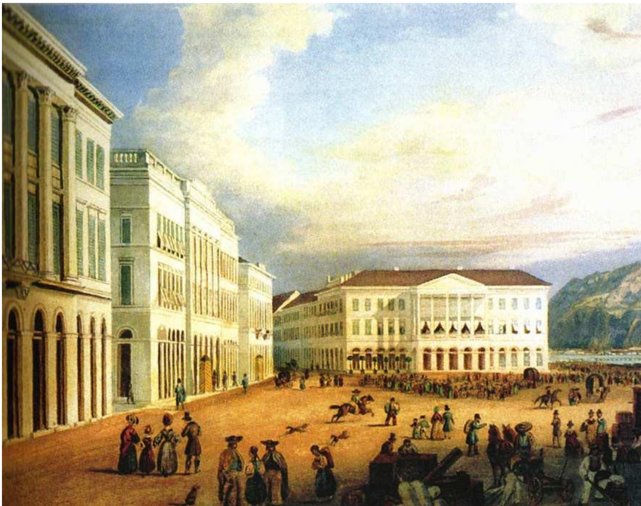
A Kereskedőtestület épülete (Lloyd-palota) a pesti Rakpiacon, a Nemzeti Casino és a Kereskedelmi Casino székháza a reformkorban.